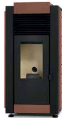
CORTEN ESCURO / CORTEN OSCURO / CORTEN FONCÉ / DARK CORTEN / CORTEN SCURO