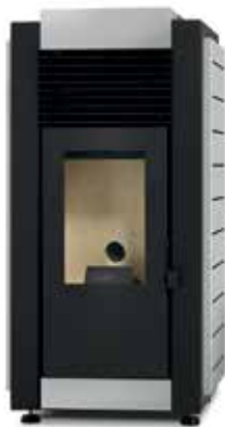
AÇO INOX / ACERO INOXIDABLE / ACIER INOXYDABLE / STAINLESS STEEL / ACCIAIO INOSSIDABILE

COLORES ESPECIALES / COULEURS SPÉCIALES / SPECIAL COLORS / COLORI SPECIALI