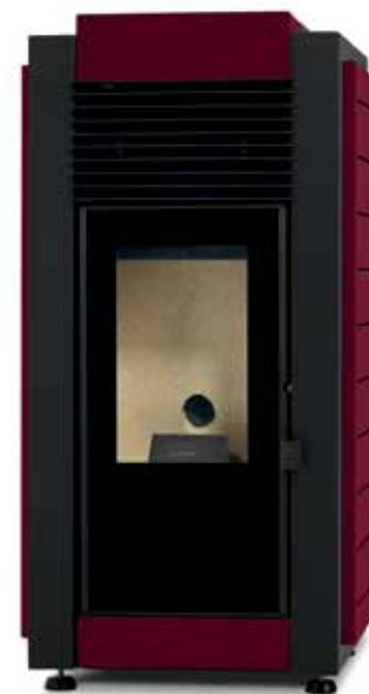
Bordeaux / Bordeaux / Bordeaux / Bordeaux / Bordeaux