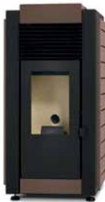
CORTEN CLARO / CORTEN CLARO / CORTEN CLAIR / LIGHT CORTEN / CORTEN CHIARO