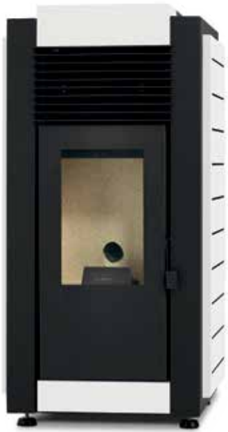
Branco / Blanco / Blanc / White / Bianco