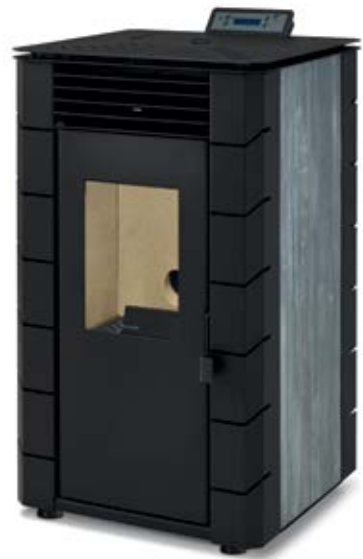
Studio / Studio / Studio / Studio / Studio