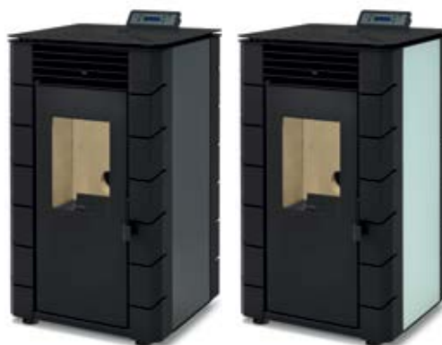
PRETO / NEGRO / NOIR / BLACK / NEGRO

ACABADO CRISTAL / FINITION VERRE GLASS FINISH / FINITURA VETRO