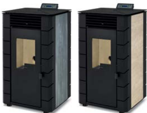
STUDIO / STUDIO STUDIO / STUDIO / STUDIO

ACABADO CERÂMICA / FINITION CERAMIQUE / CERAMIC FINISH / FINITURA CERAMICA