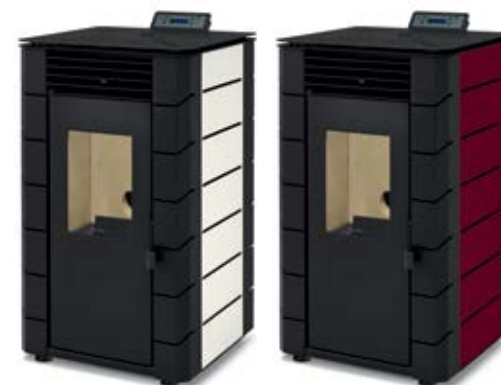
BRANCO / BLANCO / BLANC / WHITE / BIANCO

ACABADO COLOR / FINITION COULEUR COLOR FINISH / FINITURA COLORE